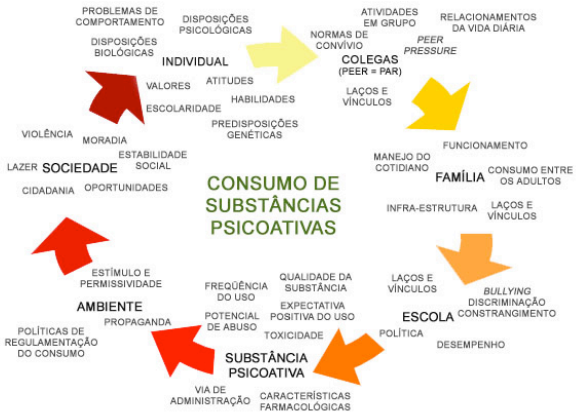
Figura 1: O padrão de consumo dos indivíduos é moldado por uma série de fatores de proteção e risco.

O conceito de síndrome de dependência e seus critérios diagnósticos ( quadro 1 ) serviram de base para a elaboração dos dois principais códigos psiquiátricos da atualidade: o CID-10 (OMS) 16 ( quadro 2 ) e o DSM-5 (APA) 17 ( quadro 3 ). O DSM-5 foi lançado exatamente vinte anos depois de sua edição anterior, o DSM-IV (1993) 18 , propondo alterações importantes – entre essas, a substituição do binômio “dependência” e “abuso”, por “transtornos relacionados a substâncias”, com diferentes níveis de gravidade ( figura 2 ) – como se comentará adiante.